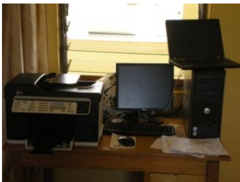
Alle diese Geräte fielen den Stromschwankungen zum Opfer