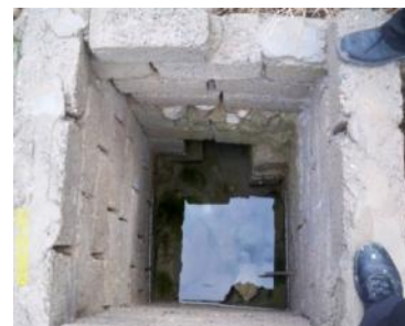
Die neue Schacht bei der Wasserquelle