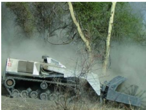
Der „Minendrescher“ im Einsatz