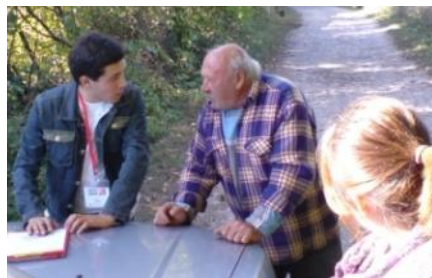
gefördert durch die Österreichische Entwicklungszusammenarbeit