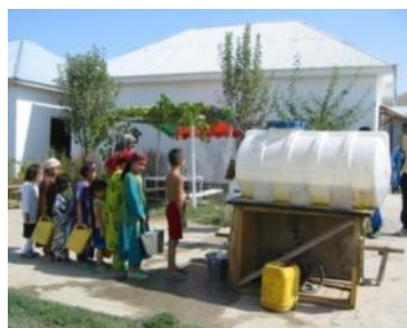
Wasserzisternen für das Suchhundezentrum und die Dorfbewohner