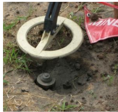
die „Unsichtbare“ Mine