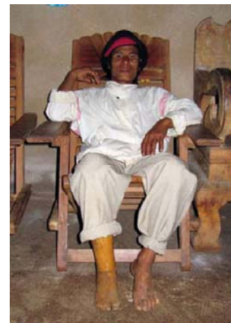
7.11.2009: ein Jahr später, mit Arbeit