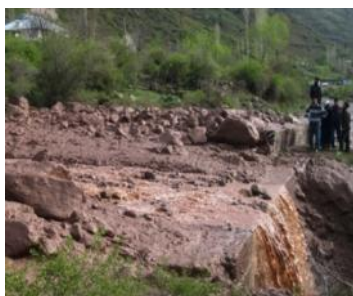
Starke Regenfälle haben die ganze Wasserleitung weggetragen

Nachdem die Naturgewalten die alte Anlage zerstört haben, war es dringend notwendig, eine neue, wetterfeste Wasserleitung zu bauen. Die von GGL finanzierte Wasserleitung liefert nun Wasser für Menschen (Entminer wie Dorfbewohner) und Tiere.