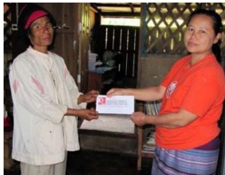
Überbrückungshilfe von GGL