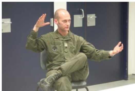
Minenexperte vom Bundesheer