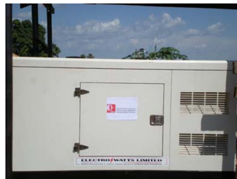
der neue Generator